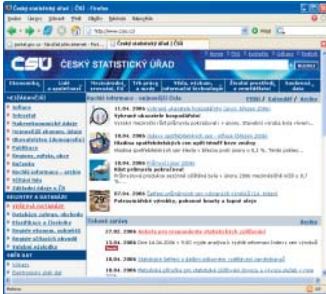
Úvodní stránka Českého statistického úřadu.

Jednotlivé obory, ze kterých chcete získat informace, najdete v horní části stránky. Kliknutím na tlačítko zobrazíte seznam nabídek a z nich si pak vyberete požadovanou položku. Některá data je možné zobrazit ve formátu HTML přímo v prohlížeči, jiná data je možné stáhnout ve formátu PDF, XLS apod.