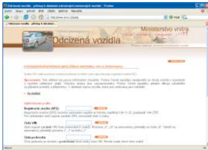
Na stránkách Ministerstva vnitra ČR můžete zkontrolovat, zda vozidlo není ukradené.