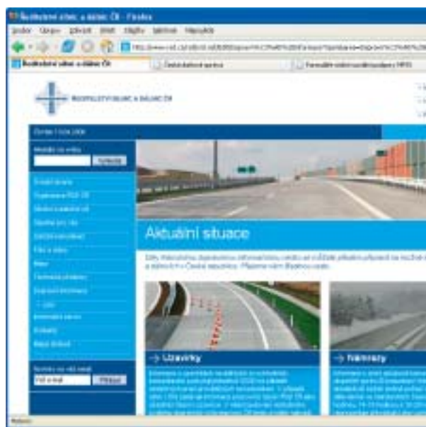
Ředitelství silnic a dálnic nabízí dopravní zpravodajství.

V databázi můžete vyhledat vozidlo podle SPZ, podle čísla VIN, podle čísla