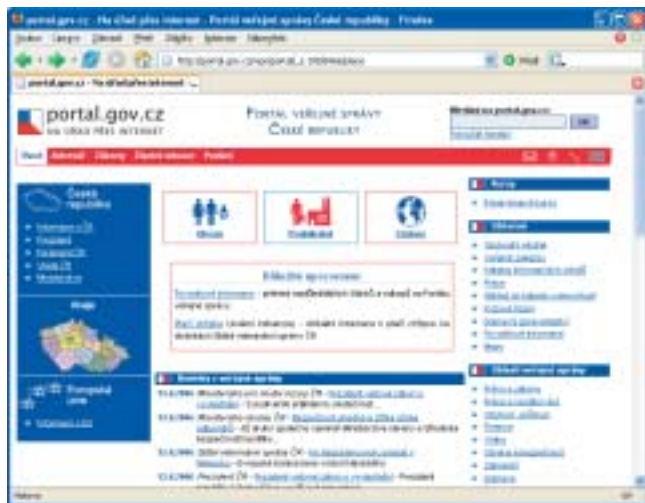
Úvodní stránka portálu.

Potřebujete-li zjistit některé makroekonomické či demografické údaje nebo třeba